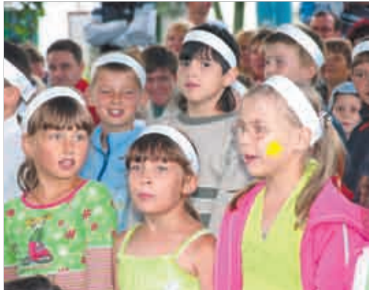
За три смены в оздоровительных лагерях «Алмаш», «Юность», «Олимпиада» отдохнули 2360 детей. К началу летнего сезона профком приобрел спортивный инвентарь для занятий шахматами, футболом, волейболом, теннисом и т.д. Для полутора тысяч детей, отдыхающих в лагерях, была организована теплоходная про-

При профкомом действует комиссия содействия семье и школе, которая занимается организацией детских праздников, конкурсов, а также посещает детские дома в Нижнекамске, Набережных Челнах, Менделеевске. По инициативе