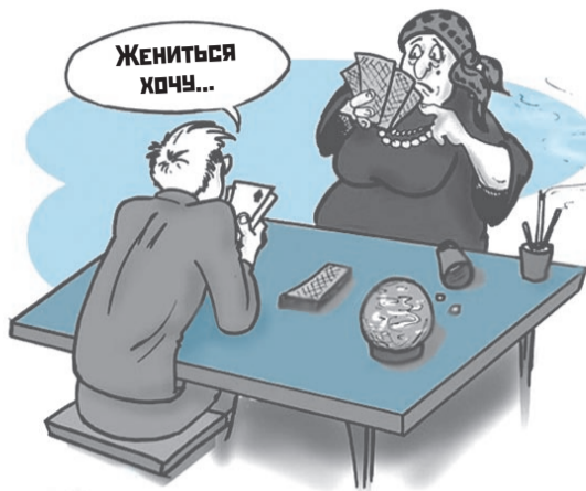
РИСУНОК ВЛАДИМИРА КИРИЧЕНКО.

Дружил я с девушкой одной. И решил предпринять серьезный семейный шаг. А чтобы ошибку на всю жизнь не совершить, обратился за советом к гадалке. А то мало ли что... Дали мне один адресок. Она, мол, в академии астрологии учится, всеми методами гадания владеет. Профессионалка от пальцев до костей.