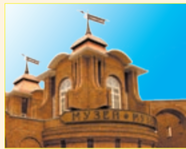
Адрес: ул. Тукая, 1.

В городской библиотеке № 2 проходит Неделя татарской литературы «Мудрость находится в книгах» . В течение семи дней в читальном зале будет функционировать необычная книжная выставка. Сотрудники библиотеки решили познакомиться своих посетителей с произведениями писателей, работающих в детективном жанре на татарском языке.