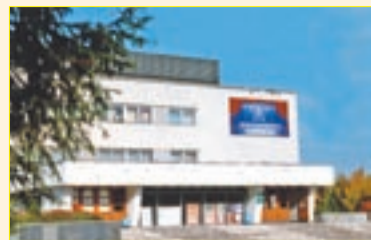
Адрес: сквер Лемаева, 14, ☎ 34-14-09