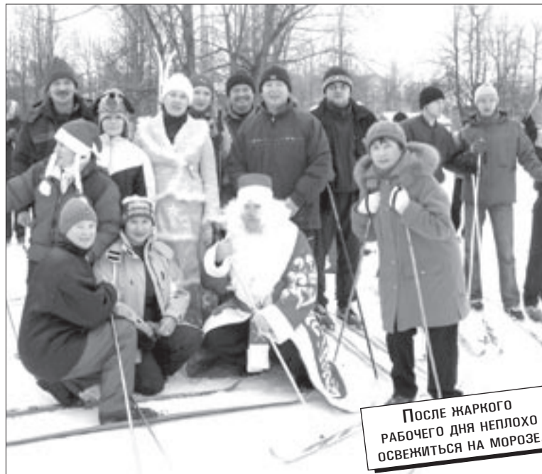
После жаркого рабочего дня неплохо освежиться на морозе.