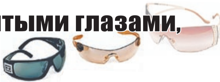
Зависимость цвета линз от поглощающей способности

Благодаря развитию технологии производства пластиковых линз сегодня ситуация изменилась. Пластик вытесняет стекло, поскольку он вдвое легче и не бьется.