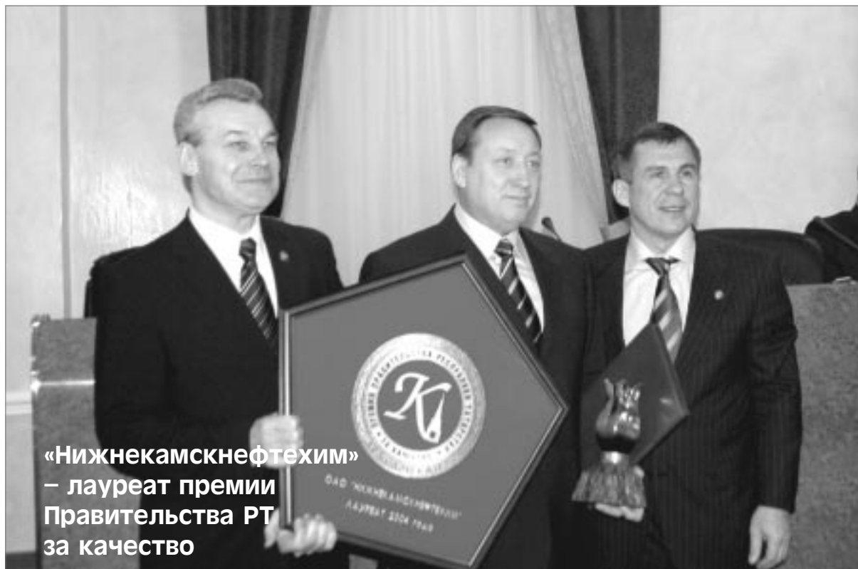
«Нижнекамскнефтехим» – лауреат премии Правительства РТ за качество

Повышенное внимание вопросам качества в республике стали уделять с середины 90-х годов. На сегодняшний день более 110 предприятий, в том числе ОАО «Нижнекамскнефтехим», имеют сертификаты соответствия системы качества требованиям международных стандартов ИСО-9000, которые являются своего рода «пропуском» на внешний рынок. Системная работа по повышению качества продукции татарстанских товаропроизводителей, как подчеркнул принявший участие в церемонии заместитель Премьер-министра РТ – министр экономики и