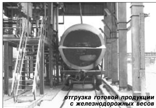
отгрузка готовой продукции с железнодорожных весов